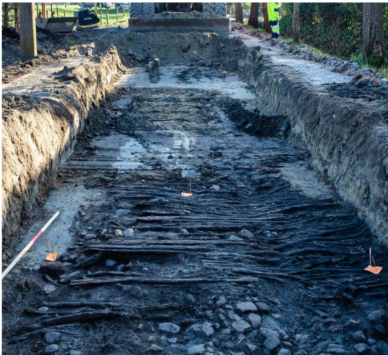
In de Monnikeredestraat in Oostkerke werd een middeleeuwse straat blootgelegd